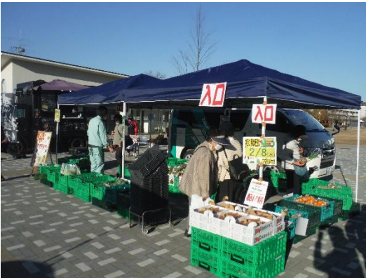
さいたま新都心公園