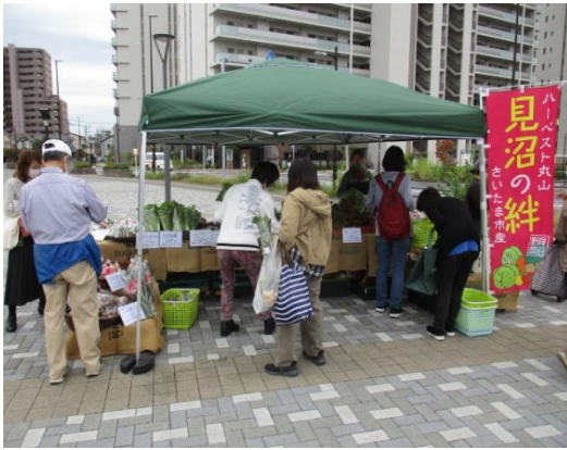
さいたま新都心公園